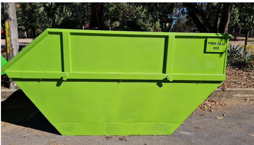
FOTO Nº 01 – Nova amostra da PA COMERCIO E SERVICOS GERAIS EIRELI - ME

A nova amostra (FOTO nº 01) foi analisada tomando-se como base as especificações técnicas contidas no SUBANEXO I-A do edital.