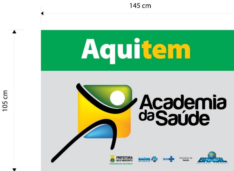
Vista Superior - placa