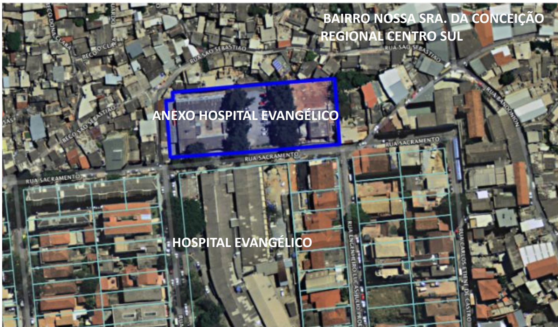
Localização do Empreendimento