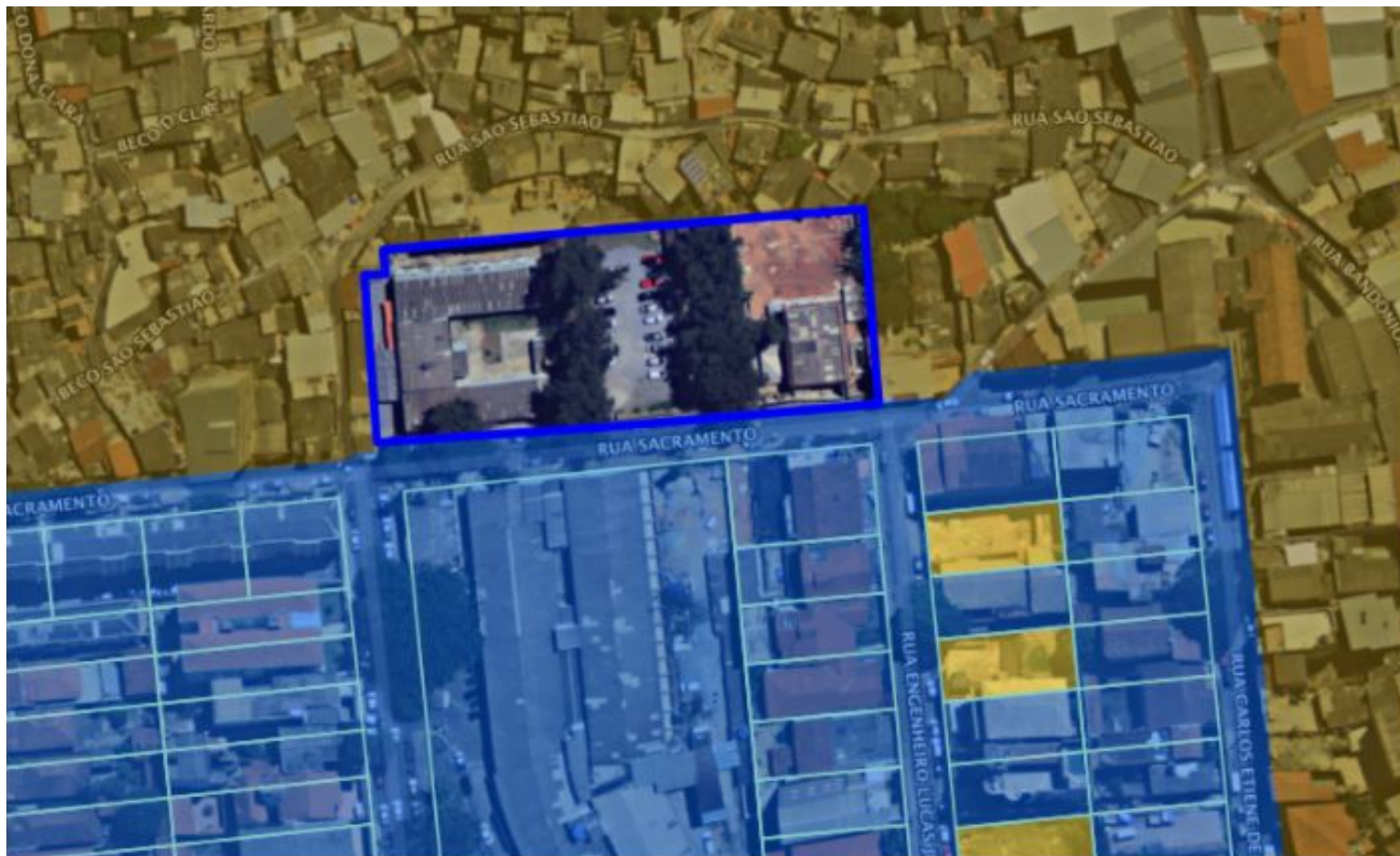
MAPA DE ZONEAMENTO ATUAL DO LOTE ANALISADO