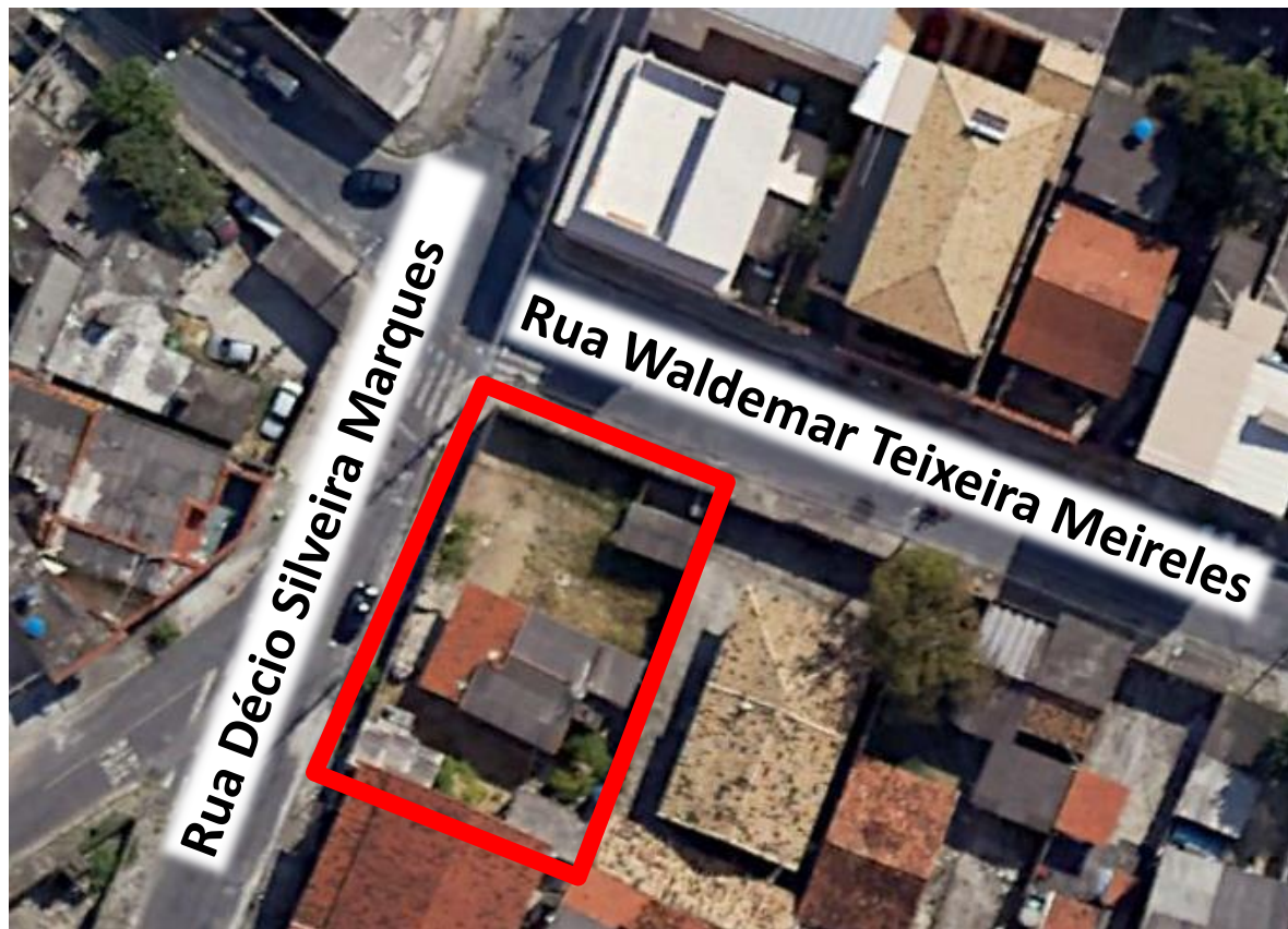
Figura 02 – Imagem de satélite de 2018 com destaque no lote do empreendimento.