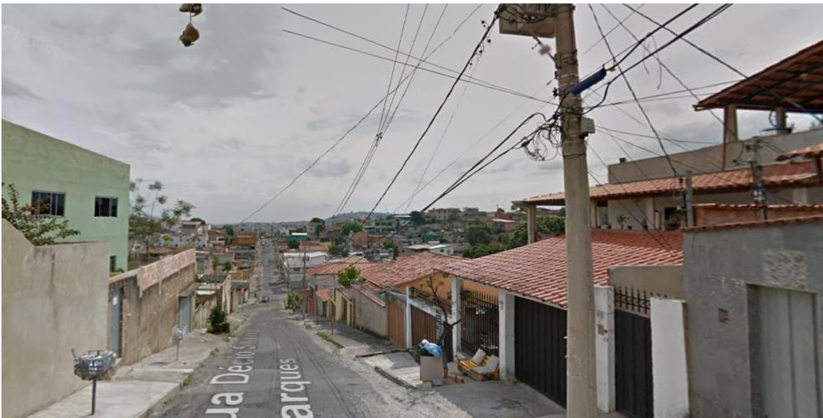
Figura 04 – Vista da Rua Décio Silveira Marques, em 2018.