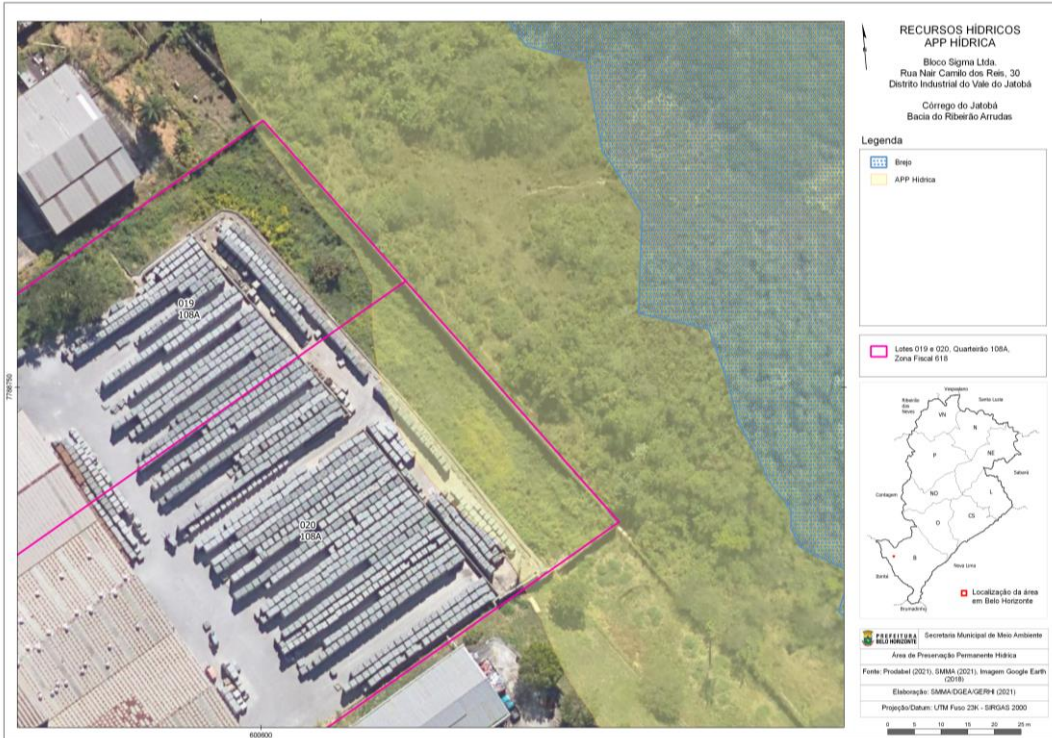
Figura 01 – Imagem aérea dos lotes em análise com demarcação da área brejosa e respectiva APP.

Ressalta-se que no levantamento planialtimétrico apresentado foi considerada uma faixa de 30 metros: “A fim de demarcar essa área da mancha no terreno do empreendimento, o empreendimento contratou um engenheiro agrimensor, que nos apresentou a locação do brejo na área verde da Prefeitura com a demarcação de 30 metros de faixa de APP.” (ver Figura 02). Entretanto, a lei federal determina uma faixa de 50 metros, conforme demonstrado na Figura 01.