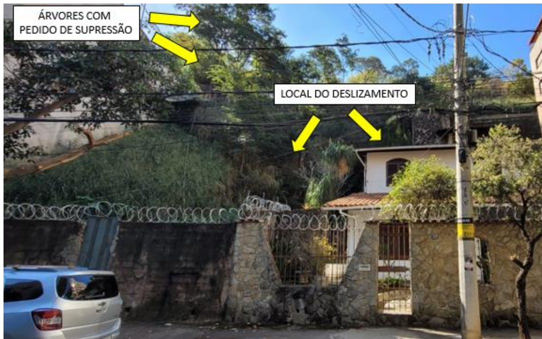
Figura 3 - Vistoria realizada dia 08/08/2023 atestando a proximidade dos indivíduos arbóreos com a área afetada pelos deslizamentos.