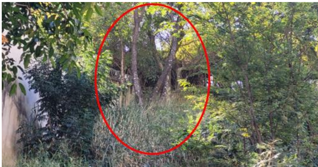
Figura 4 - Indivíduos arbóreos com pedido de supressão situados no limite do lote (Fonte: GELIN/SMMA/2023).