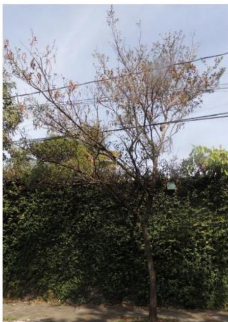
Figura 1: ipê amarelo 1

Verificou-se no terreno a presença de espécie que possui proteção legal, o ipê-amarelo ( Handroanthus chrysotrichus ) (Figuras 1), segundo a Lei Estadual nº 9743/88, que declara de interesse comum, de preservação permanente e imune de corte, o ipê-amarelo, no Estado de Minas Gerais.