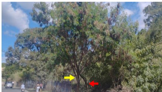
Figura 2B. Situação dos espécimes 1 e 2 (Leucenas) solicitados para supressão.