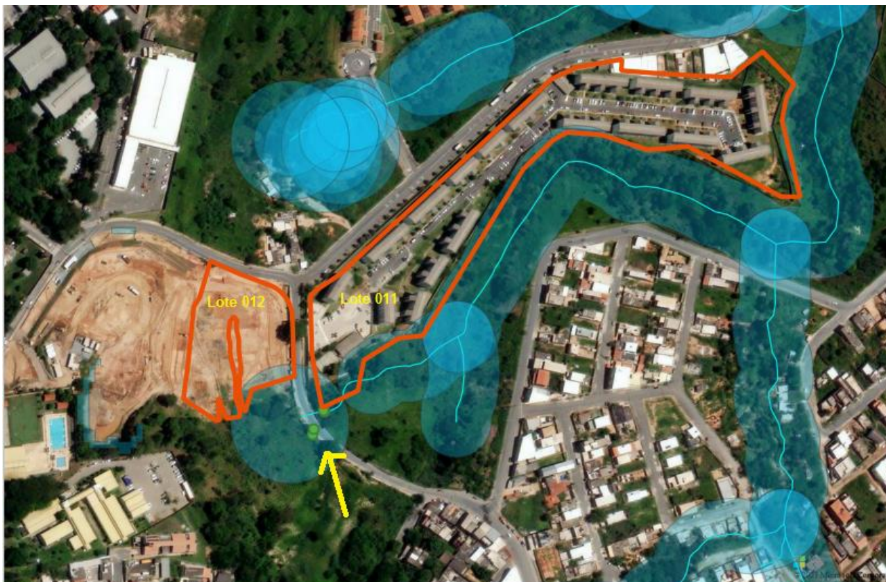
Figura 1. Lotes 011 e 012 - polígono vermelho - da Rua dos Borges, situados parcialmente em APP, nascente e curso d'água respectivamente - mancha azul. Detalhe da seta amarela apontando para os espécimes a suprimir (pontos verdes) localizado em APP . (BHMmaps, 2023).

Em abril de 2023 o empreendedor, por meio dos protocolos nº 03943/23 e nº 04303/23 solicitou supressão dos espécimes arbóreos constantes no Tabela 1 e expressos na figura 2A-C, para executar as obras de implantação do trecho da Rua Augusta Sacchetto Scalzo na testada do ELUP (*1), bem como implantar/construir um dispositivo de drenagem com lançamento em área pública com frente para a Rua Augusta Sacchetto Scalzo, na margem oposta ao Villa Real (*2):