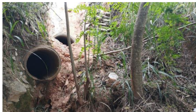
Figura 2C. Localização dos espécimes 3 (Tamboril) e 4 (Ipê de jardim) solicitados para supressão