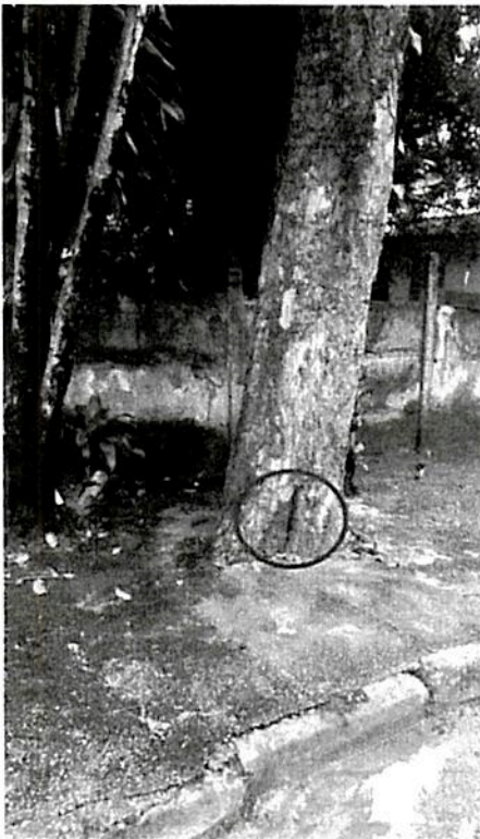
Foto 3 - Lesão junto à base da árvore.