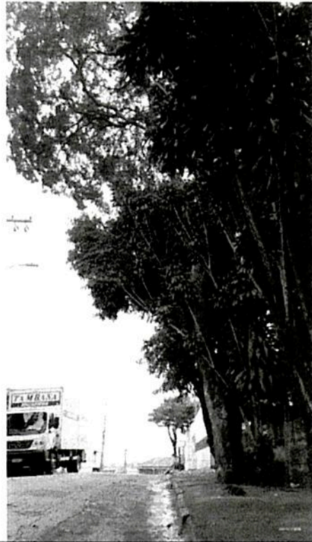
Foto 2 - Visão geral da árvore.