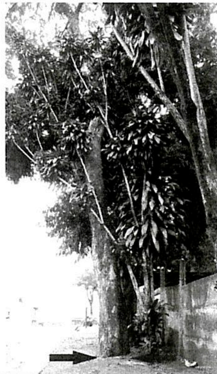
Foto 4 - Árvore no meio do passeio, obstruindo, parcialmente, a passagem.