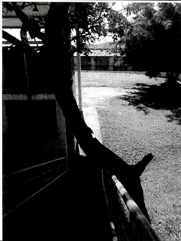
Foto 3 - Tronco apoiado no corrimão.