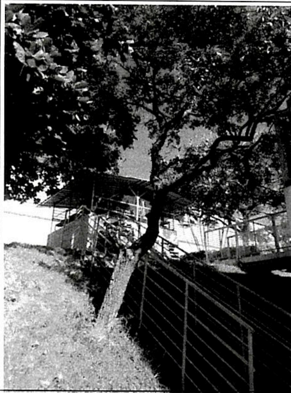
Foto 1 - Visão geral da árvore.