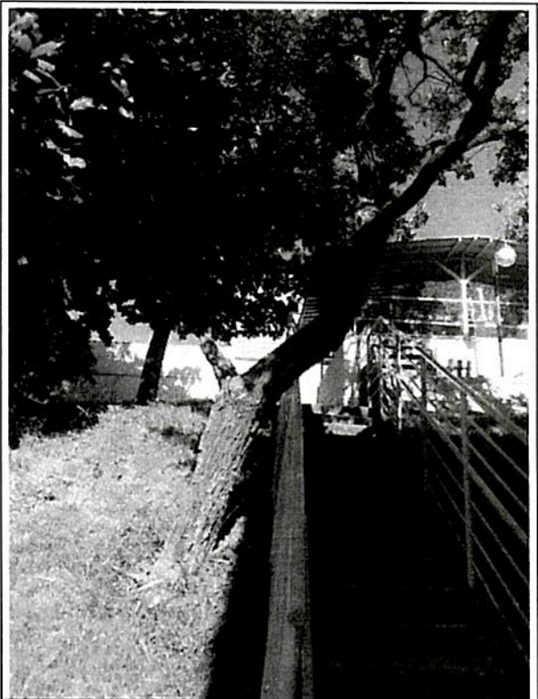
Foto 4 - Inclinação excessiva, indícios de tombamento.