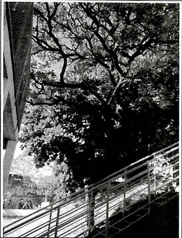
Foto 2 - Inclinação excessiva.