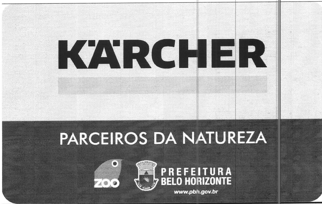
Modelo de placa para ser instalado na parede