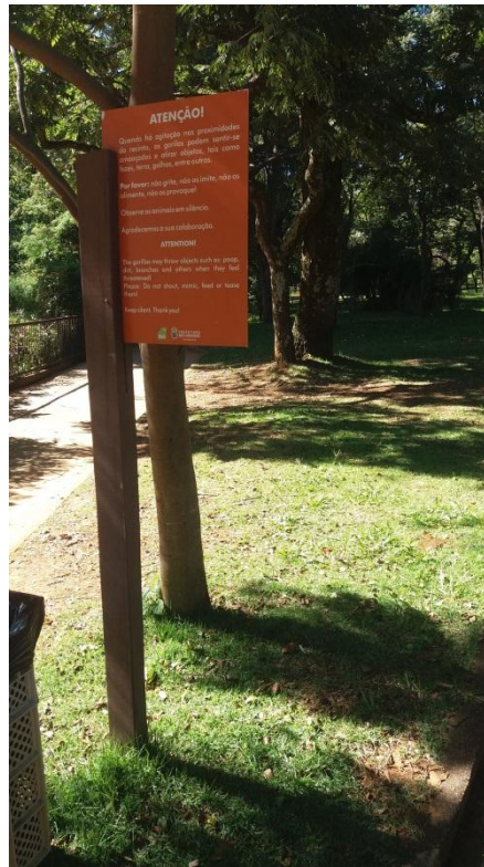
01 poste lateral (placa simples)