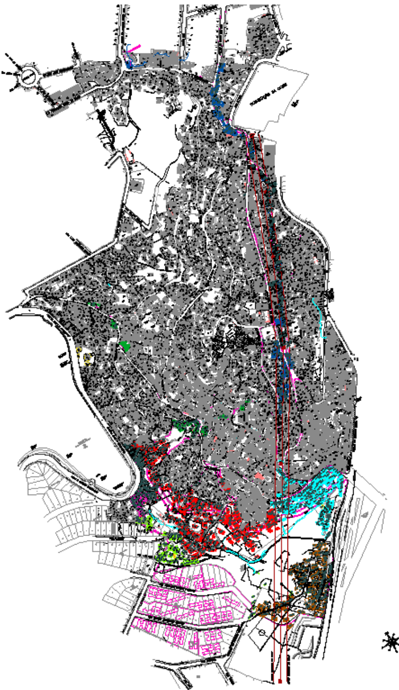
Figura 02: Projeto de Remoção Vila Viva Santa Lúcia