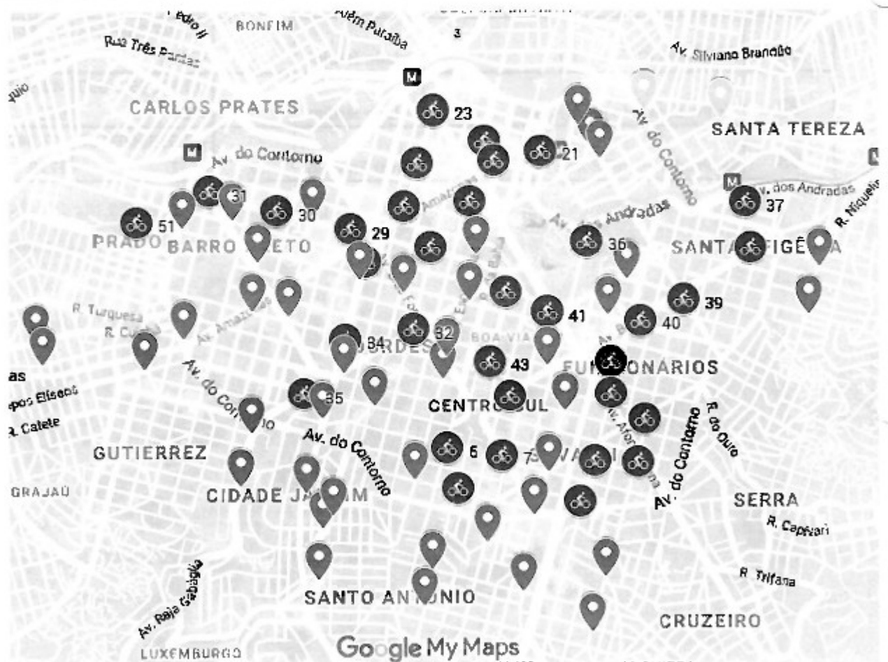
Localização das novas estações do lote 4 na cor amarela e do lote 7 na cor roxa.