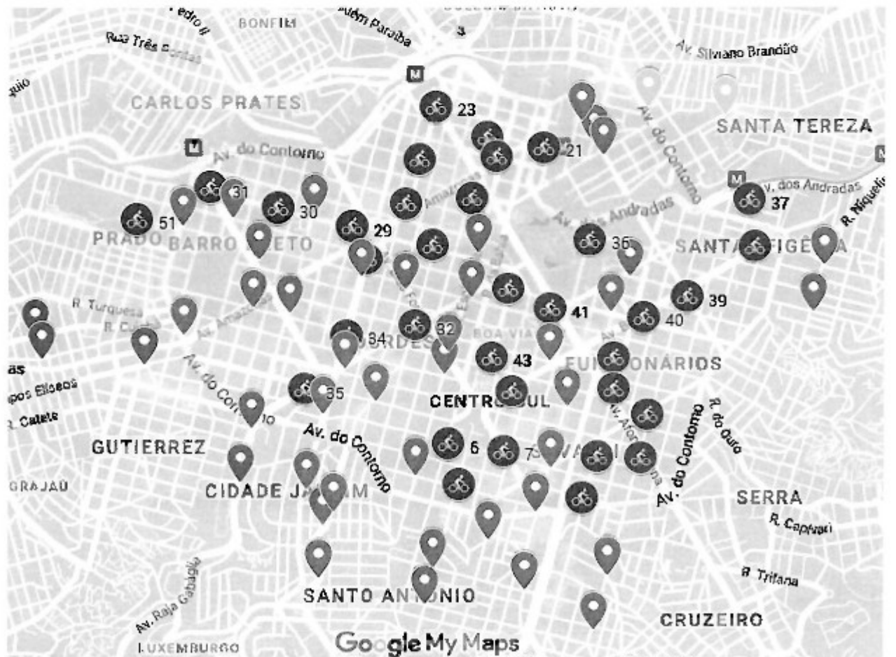
Localização das novas estações na cor verde.