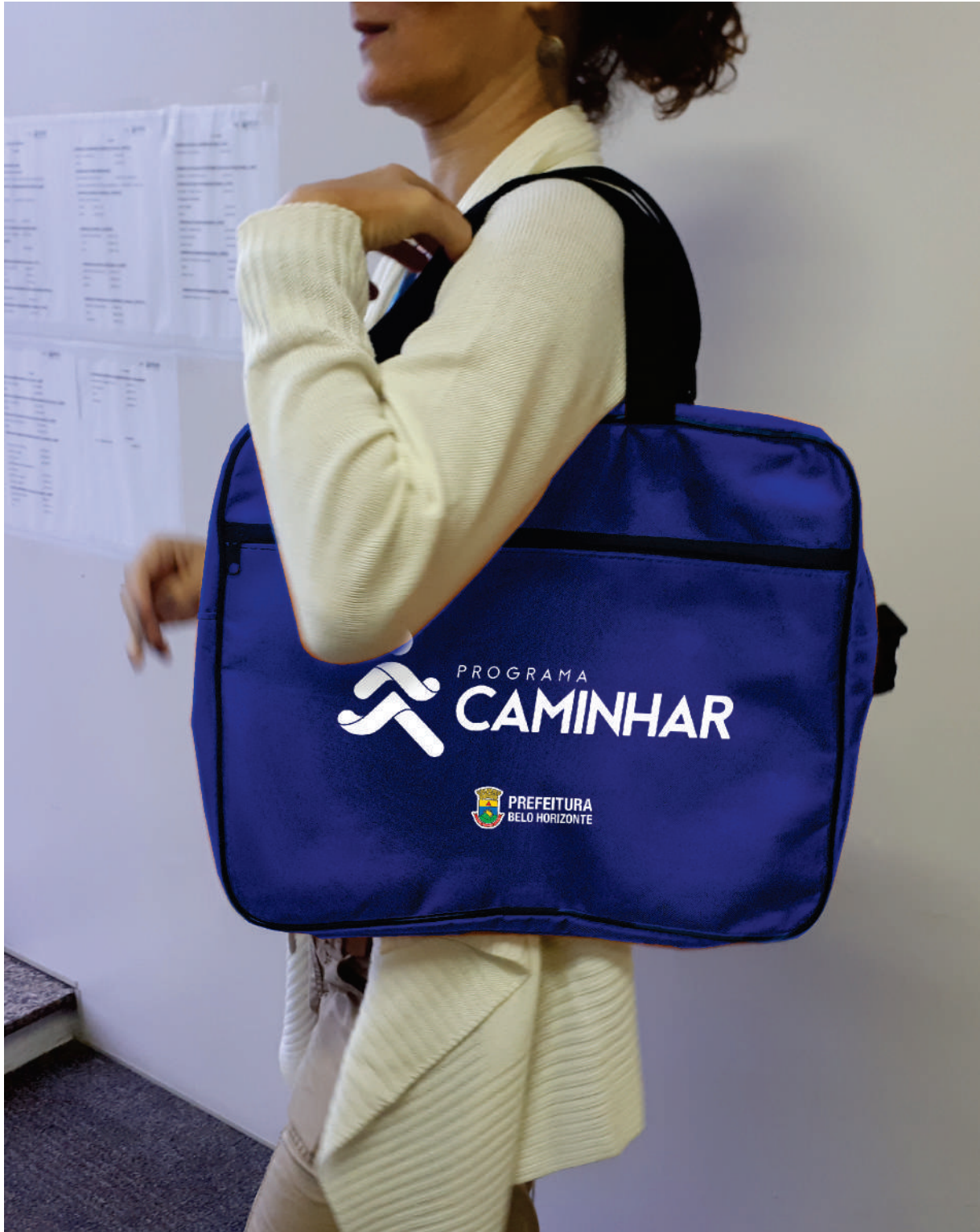
Imagem meramente ilustrativa, referência para orientação de posicionamento. Ajustar as imagens conforme área disponível na bolsa.