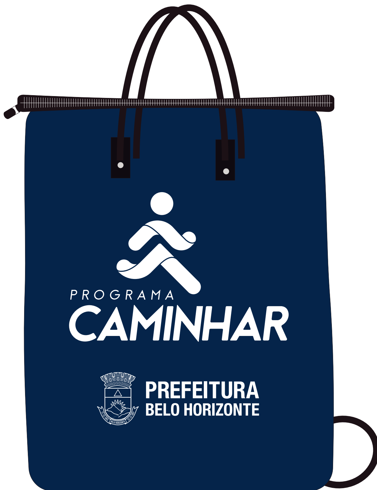
Imagem meramente ilustrativa, referência para orientação de posicionamento. Ajustar as imagens conforme área disponível na sacola.