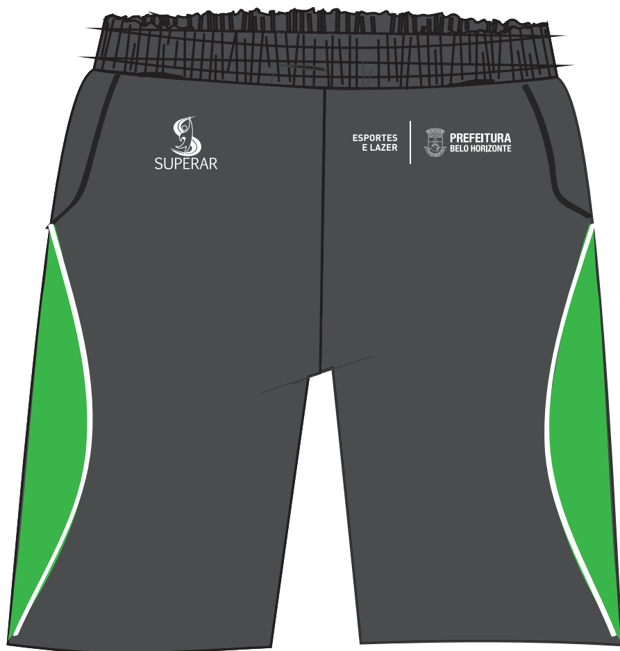
Imagem meramente ilustrativa, referência para orientação de posicionamento. Ajustar as imagens conforme área disponível na calça.